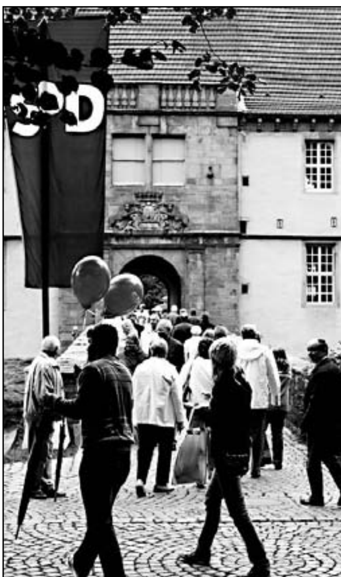
Sehr gut besucht war das SPD-Familienfest rund um das Strünkel-Schloss auch in diesem Jahr. Kein Wunder, hat die Veranstaltung doch inzwischen die Ausmaße eines kleinen Volksfestes erreicht. Zahlreiche Herner Vereine und Organisationen nutzten die Plattform erfolgreich, um sich darzustellen.

„Superpinky“ tut es, die „Hauptchefmaus“ hat dagegen nichts damit am Hut. Worüber wir uns da - mal wieder - mokieren? Über die schlechten Umgangsformen beim Verfassen von E-Mails. Was bei Geschäftsbriefen nach wie vor ein Muss ist, sollte doch auch bei offiziellen E-Mails gelten: Ein nachvollziehbarer, seriöser Absender(name) und eine klare Betreffzeile sind das Minimum - finden nicht nur wir.